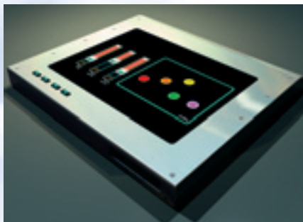
LEMUR : contrôleur tactile de JAZZ MUTANT

JAZZ MUTANT Interfaces hommes machines pour application au monde de la création musicale artistique) et CONTE (jardineries, pépinières).